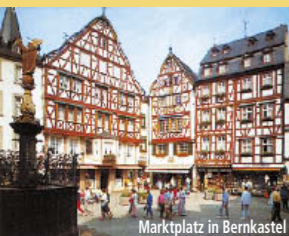
Marktplatz in Bernkastel

Moselaufwärts vorbei am Hafen nach Andel, Wendepunkt, in Richtung Schleuse Zeltingen und wieder zurück nach Bernkastel.